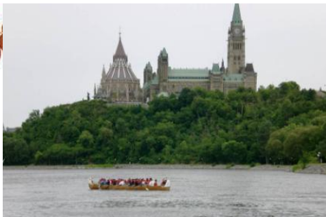
El Parlamento y una canoa en el río de Ottawa

La Cabana de Azúcar de Vanier, inaugurada en 1998, muestra cómo se hacía el jarabe de arce (o "miel de maple") en los viejos tiempos: con un pequeño agujero en el árbol se recolecta la savia dulce, llamada "agua", que después se pone a hervir.