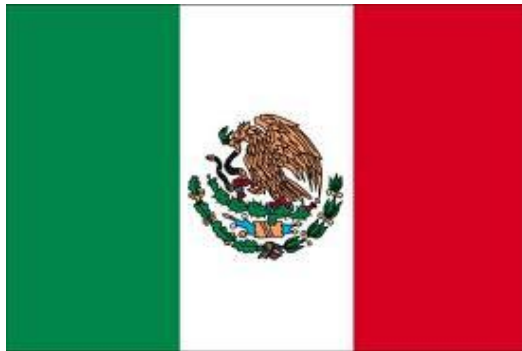
México / Mexique